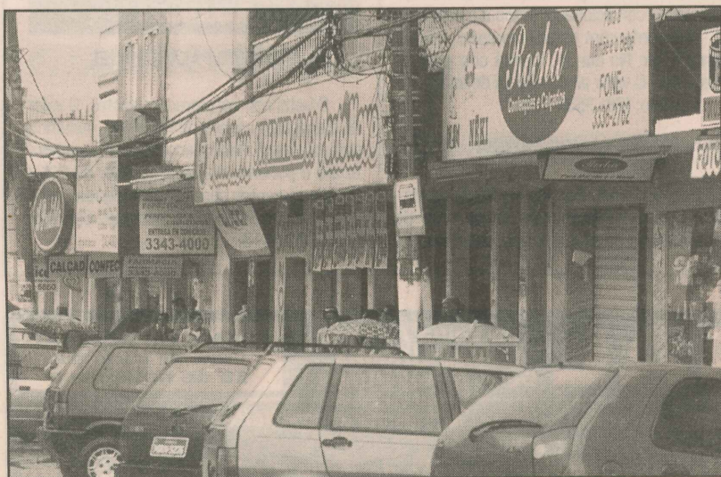
Variedade de estabelecimentos comerciais no bairro

OBS.: Esses números referem-se à região que inclui Porto de Santana, Presidente Médice, morro do Sesi e Aparecida, que formam a Grande Porto de Santana. Os dados relacionados apenas a Porto de Santana não foram fornecidos pela Prefeitura de Cariacica.