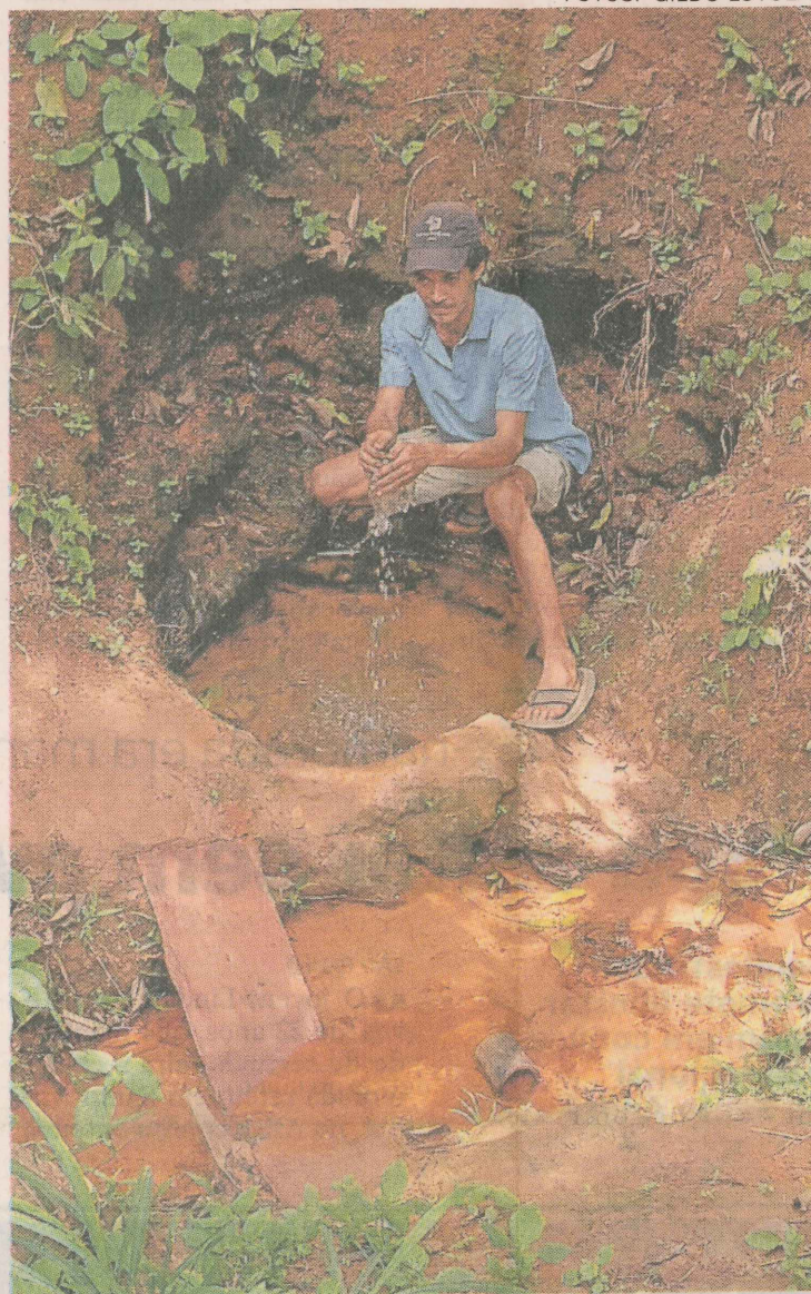
ÁGUA PURA. A nascente principal tem água clara e limpa, que pode ser consumida pelos moradores sempre que houver necessidade. O local é vigiado e protegido pela comunidade