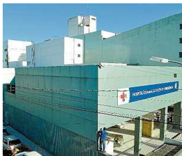
A reforma do hospital será concluída em 2016

Confira vídeo mostrando as dependências do novo Hospital São Lucas após a reforma.