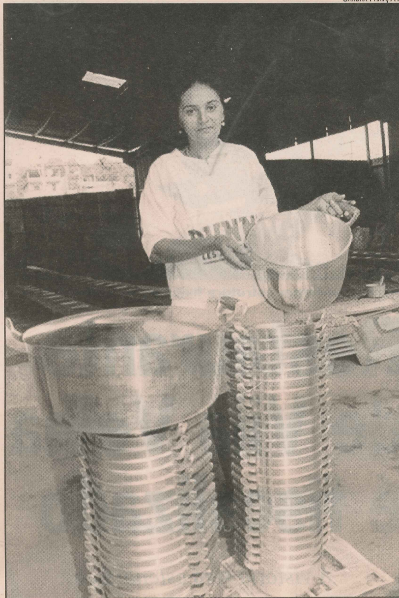
As panelas custam de R$ 5,00 a R$ 40,00

Outro objetivo da organização é o aperfeiçoamento da qualidade do produto. Um dos parceiros do empreendimento é a Prefeitura de Cariacica que tem sido responsável pela liberação de recursos para o financiamento da produção. Já foram liberados recursos em torno de R$ 65 mil.