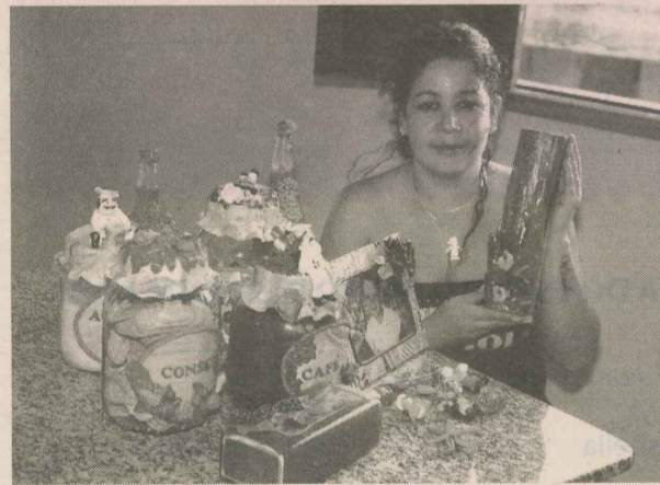
LÉIA produz objetos em biscuit para vender e decorar sua casa

“Minhas vizinhas vêm aqui, veem o que fiz de diferente e encomendam”.