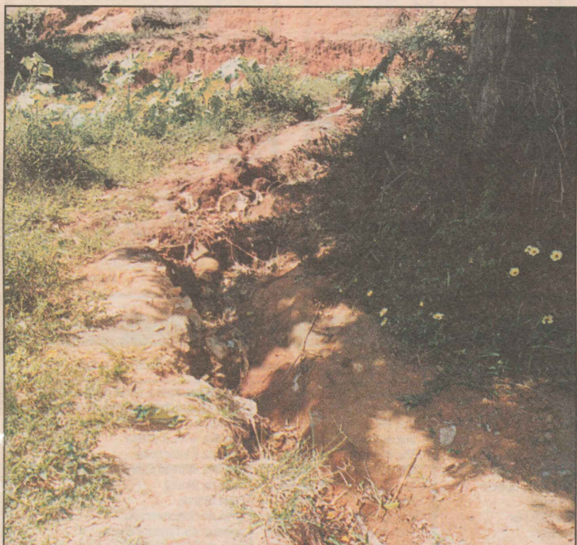
Local onde o esgoto das casas é lançado

Resposta: A Secretaria Municipal de Serviços Urbanos e Transportes informou que hoje enviará uma equipe ao bairro para verificar a caixa de esgoto. Quanto ao saneamento básico, não há previsão para a realização das obras.