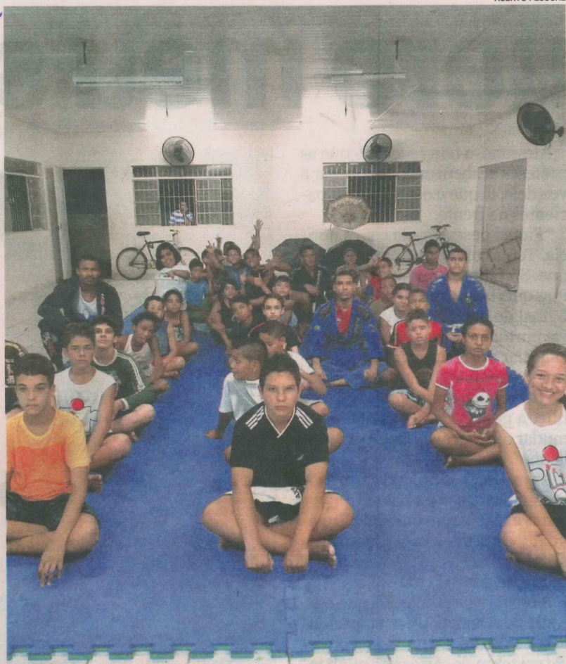
ALUNOS do projeto durante aula: lista de espera para participar

Segundo os próprios moradores, desde a última vez que a Tribuna com Você esteve em Santana, em 2010, a segurança no bairro melhorou, com policiamento constante e presença de viaturas da Polícia Militar pelo bairro.