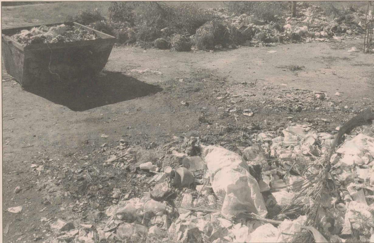
Uma parte da praça de Santana, em Cariacica, transformou-se em depósito de lixo

tenção que prevê a reforma total da área em Santana, incluindo a instalação de playground.