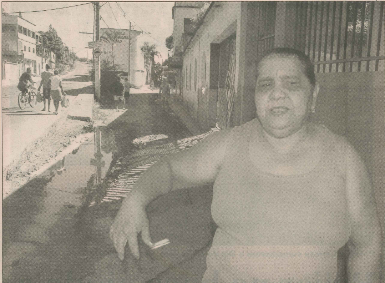
Celina: "Meu filho foi morar em outro bairro devido ao abandono na infra-estrutura aqui"