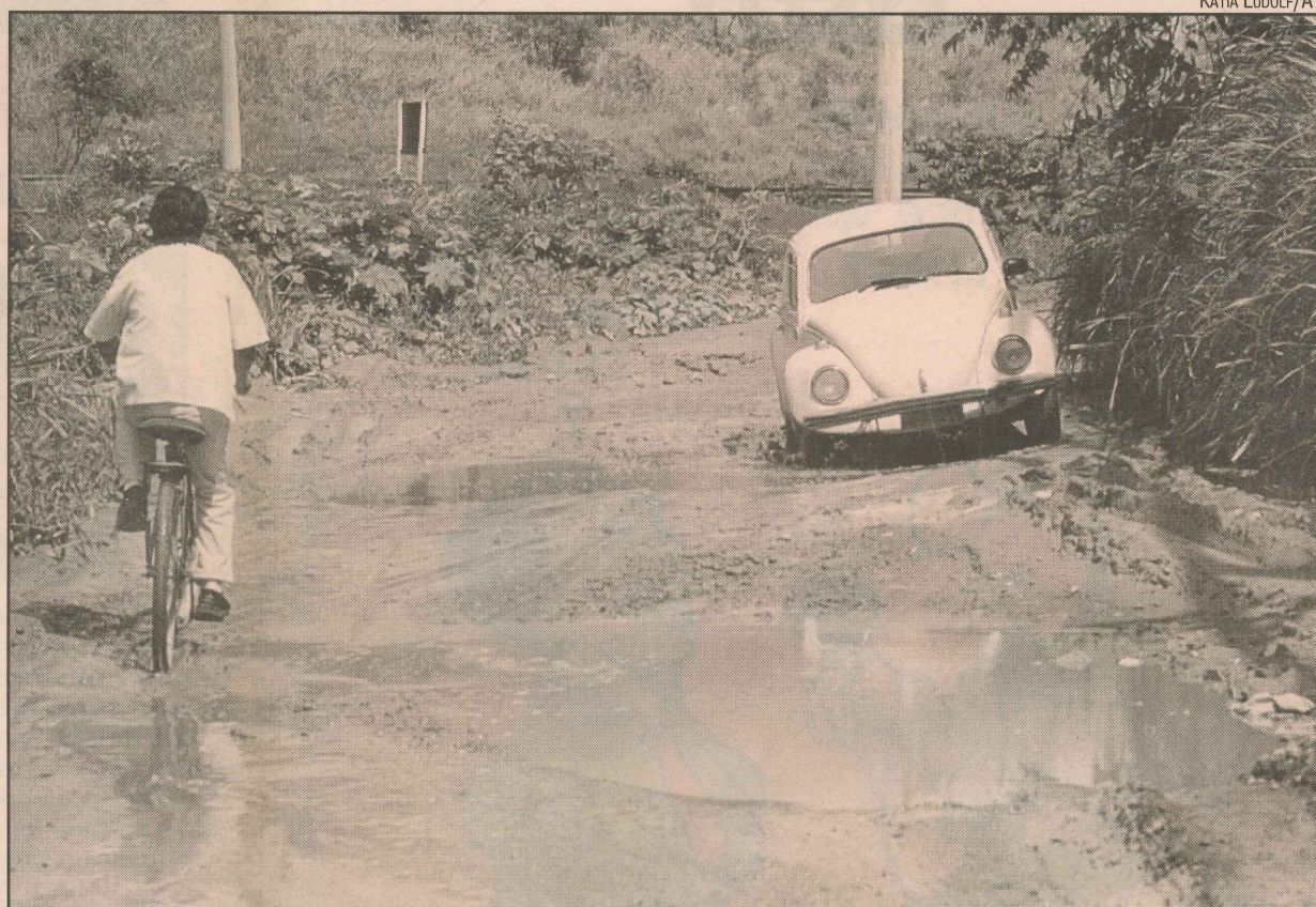
Com a chuva, motoristas têm dificuldade em trafegar pela rua André do Espírito Santo

Alguns ressaltaram que costumam dar um jeito nas ruas, calçando-as com bloquetes fabricados numa cooperativa do bair-