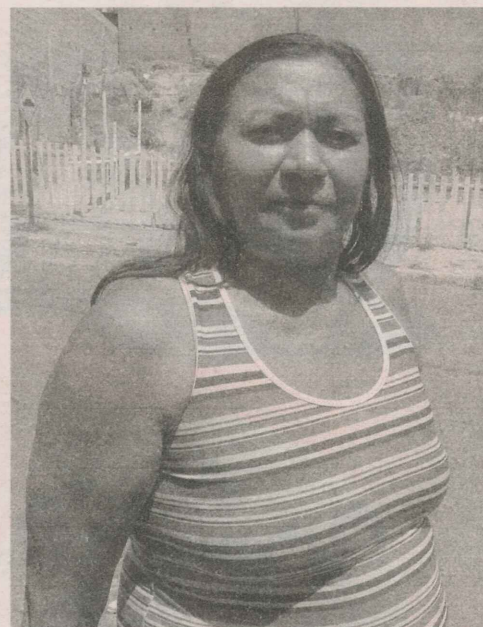
QUITUTES de Fátima fazem sucesso em feira