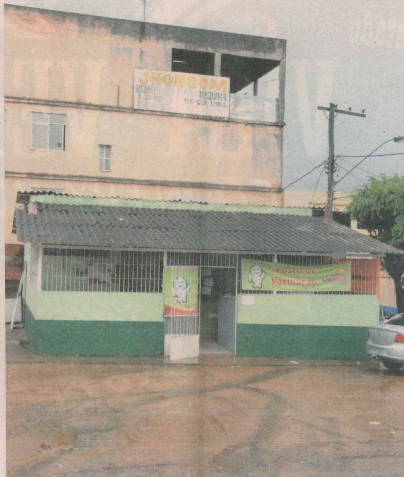
UNIDADE de saúde atual tem 36 metros quadrados e atende a cinco bairros