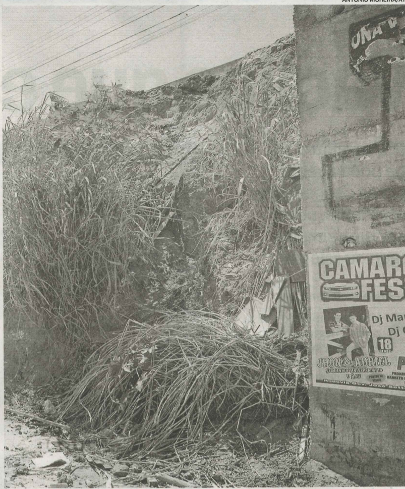
OBRA NO MURO vai conter o deslizamento de terra em períodos de chuva