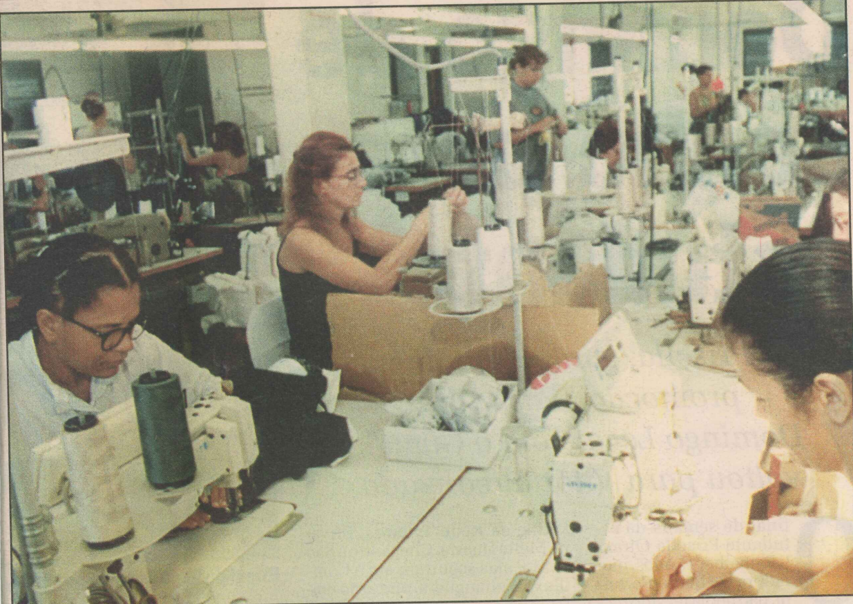
Confeção de uniformes na empresa Garça: 13 anos de história no bairro Vera Cruz