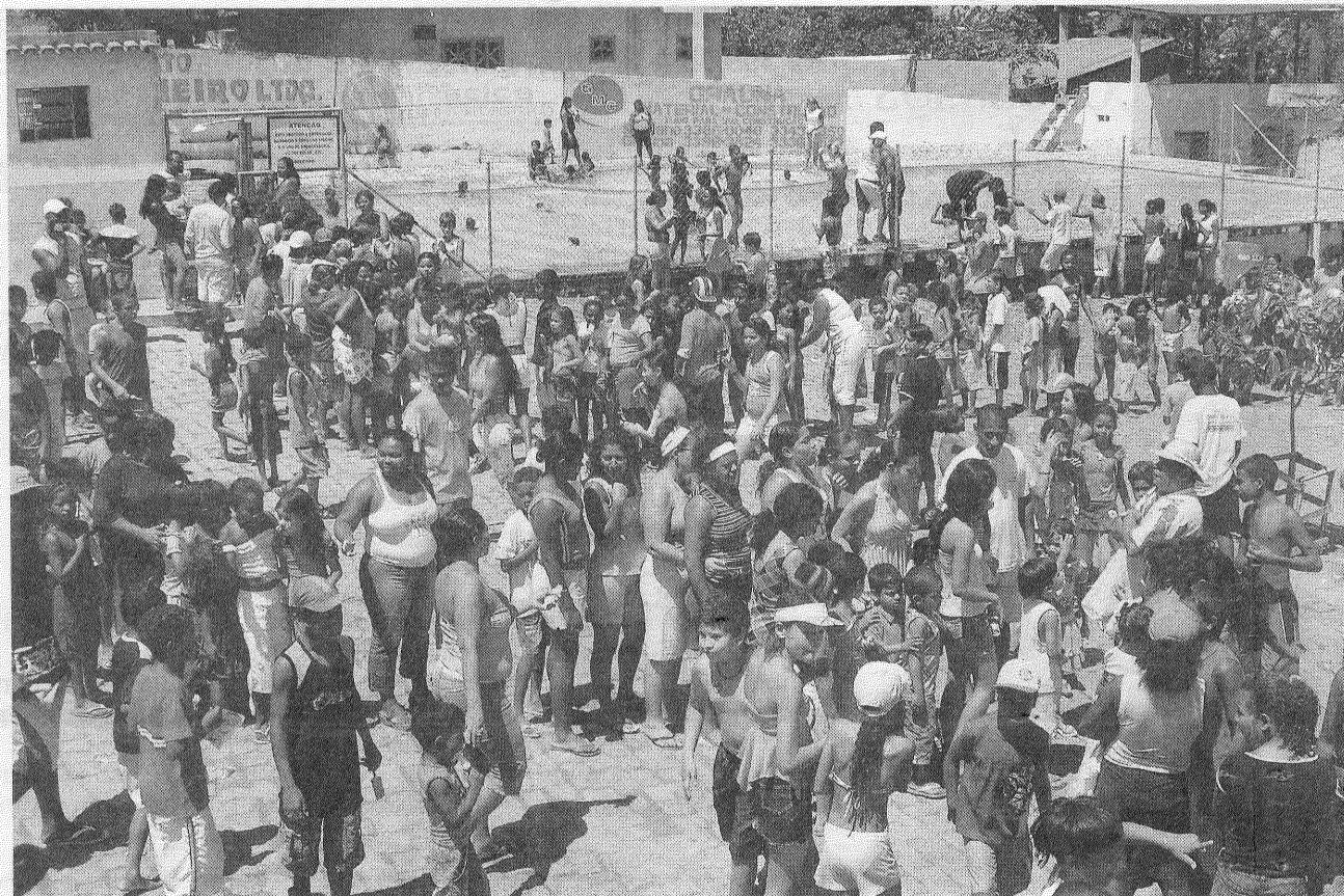
COMEMORAÇÃO. No dia 12 de outubro, a garotada acorda cedo e se prepara para participar de uma grande animação. O local de reunião é no Clube Canarinho.

mobilizam na questão social e participam juntamente com a administração pública para oferecer outros serviços como corte de cabelo, atendimento médico com pediatra e clínico geral.