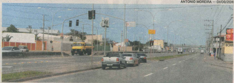
RODOVIA DO SOL: região deve receber grandes empreendimentos

“Isso também possibilitará o surgimento de novos bairros no futuro, inclusive dentro da Grande Terra Vermelha”, observou.