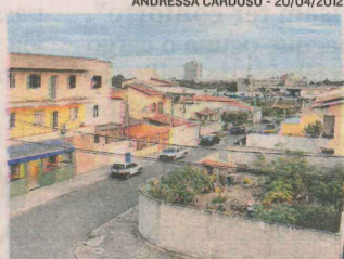
COLINA DE LARANJEIRAS

VAI GANHAR MAIS 5.601 MORADORES ATÉ 2017 13.502 pessoas residem no bairro atualmente 1.867 imóveis estão em construção em novos condomínios R$ 2.715 é o valor do m 2 dos apartamentos de dois quartos 19,6% de valorização registrada nos últimos seis meses