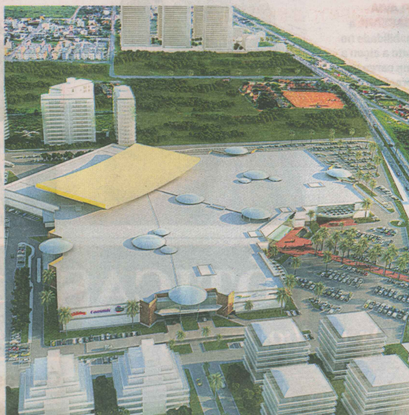
SHOPPING BOULEVARD, em construção no bairro Itaparica: crescimento

É preciso ainda descentralizar os investimentos, incentivando para que o crescimento se espalhe para outros bairros, além dos litorâneos.”