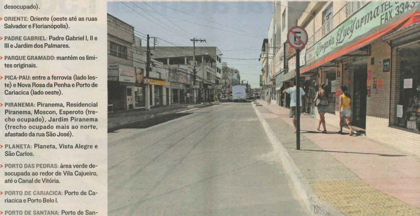
BAIRRO CAMPO GRANDE engloba Dona Augusta (lado oeste, até avenida Alice Coutinho) e Laranjeiras

> RETIRO SAUDOSO: Novo Jardim, Retiro Saudoso (até rua Ouro Preto, ao norte, e até rua Maria Júlia e córrego a sudeste).