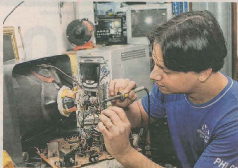
EMPREENDEDOR individual é cadastrado. Na cidade, são 1.297

Segundo dados do último dia 10, a cidade ocupa o 26º lugar no ranking nacional de cadastro de empreendedores individuais, com 1.297 inscrições.