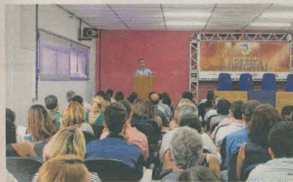
REUNIÕES TEMÁTICAS e seminários são feitos para ouvir as propostas da população sobre o futuro da cidade

A atualização da agenda começou em dezembro passado. Já aconteceram cinco reuniões temáticas e cinco seminários setoriais.