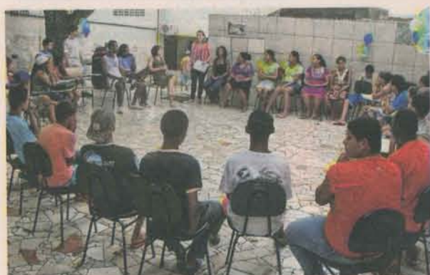
GRUPO em atividade do projeto, que faz parte do Pronasci e funciona em Nova Rosa da Penha II

No decorrer do curso, os participantes podem propor as ativida-