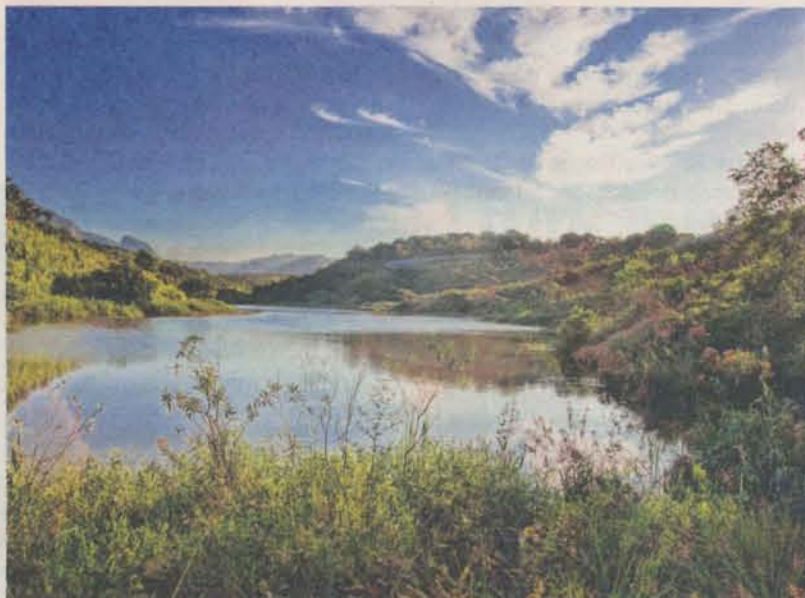
O PERÍMETRO urbano também abriga áreas verdes, quase sem moradores

> FORMATE: área verde desocupada às margens do Rio Formate, na divisa municipal de Viana. Seus limites se fazem a nordeste pela rua Aimorés, no antigo bairro Vila Rica (denominado atualmente pelo POT de Santo