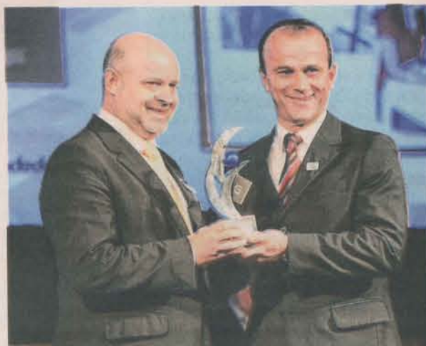
PREFEITO DE CARIACICA, HELDER SALOMÃO, recebendo prêmio nacional