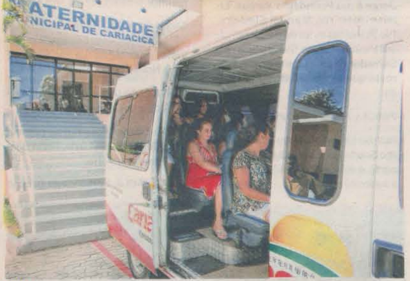
VAN leva as futuras mães para fazerem os exames pré-natais no local