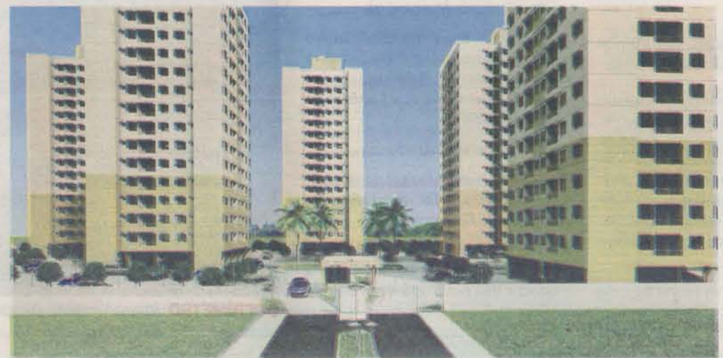
CONDOMÍNIO COLINAS DO SOL, que começou a ser construído em maio, faz parte do programa Minha Casa, Minha Vida, do governo federal. Fica no bairro Santana, em Cariacica