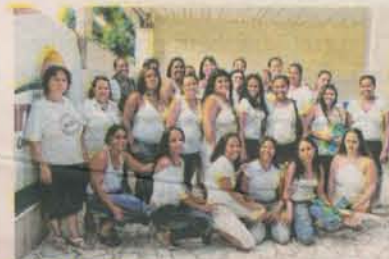
MULHERES fazem capacitação

Cariacica possui cinco unidades do Cras, localizadas nos bairros Porto Novo, Padre Gabriel, Campo Verde, Mucuri e Nova Rosa da Penha.