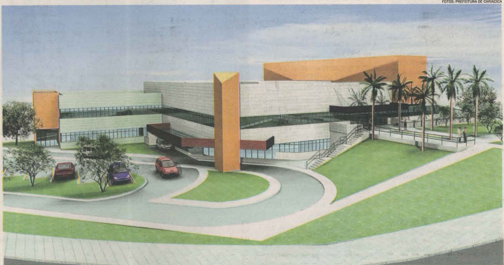
IMAGEM mostra o projeto do Pronto-Atendimento de Alto Lage, que ficará em uma área de 3.500 mil metros quadrados e terá 28 leitos de repouso

O atendimento à população pode ser feito no posto ou na própria