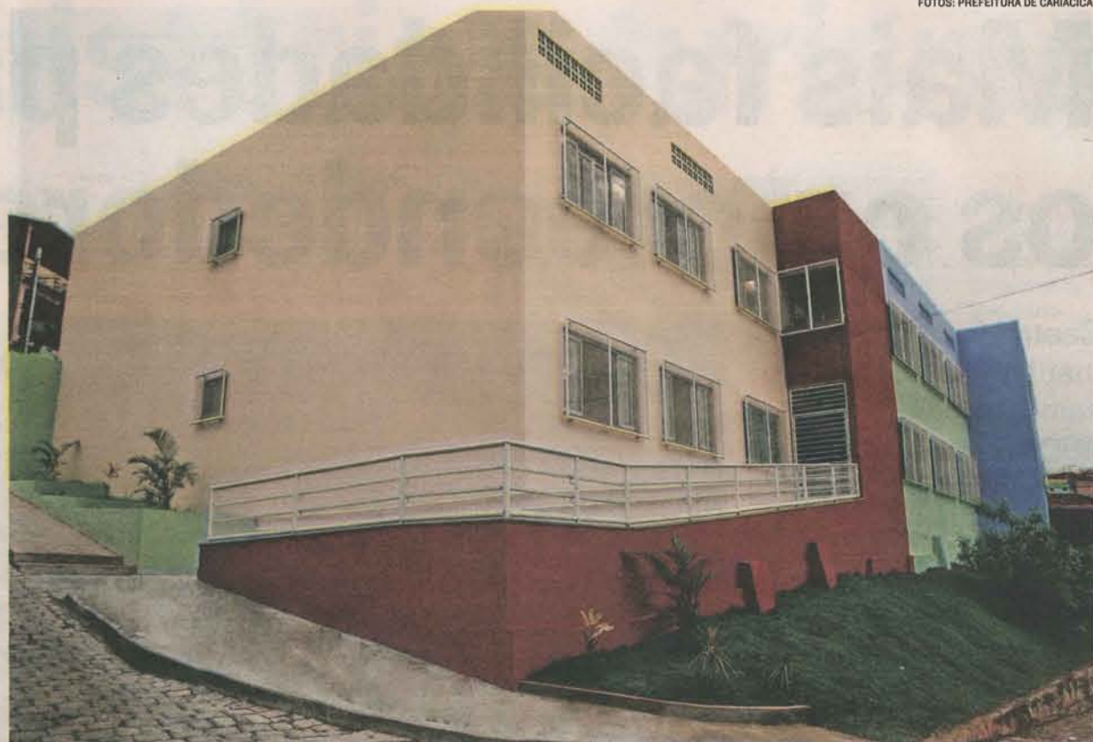
O CMEI ERENITA RODRIGUES TRANCOSO fica no bairro Itacibá e será inaugurado hoje