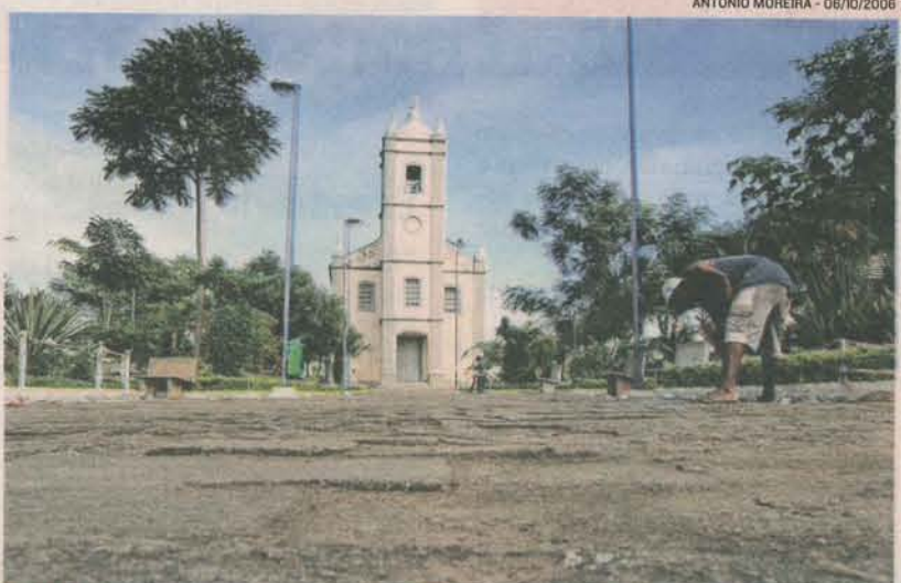
PRAÇA Marechal Deodoro, em Cariacica-Sede, é a primeira do município

> FUNCIONAMENTO: visitas com agendamento.