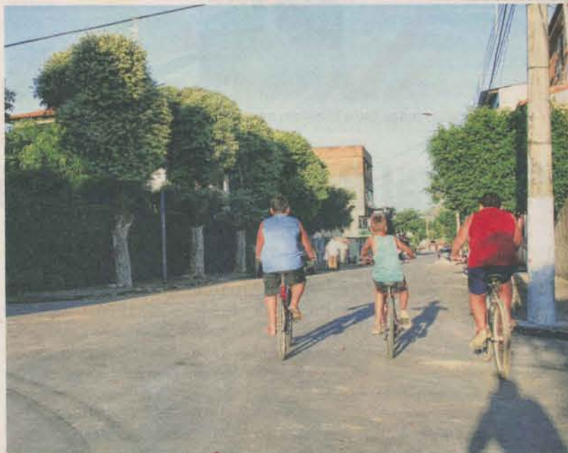
RUAS dos bairros receberão placas e numeração das casas será feita

> VISTA MAR: Vista Mar, Vale do Marinho, Ipiranga e trecho do antigo bairro Marinho, até a rua Santos Dumont e rua Barão de Monjardim.