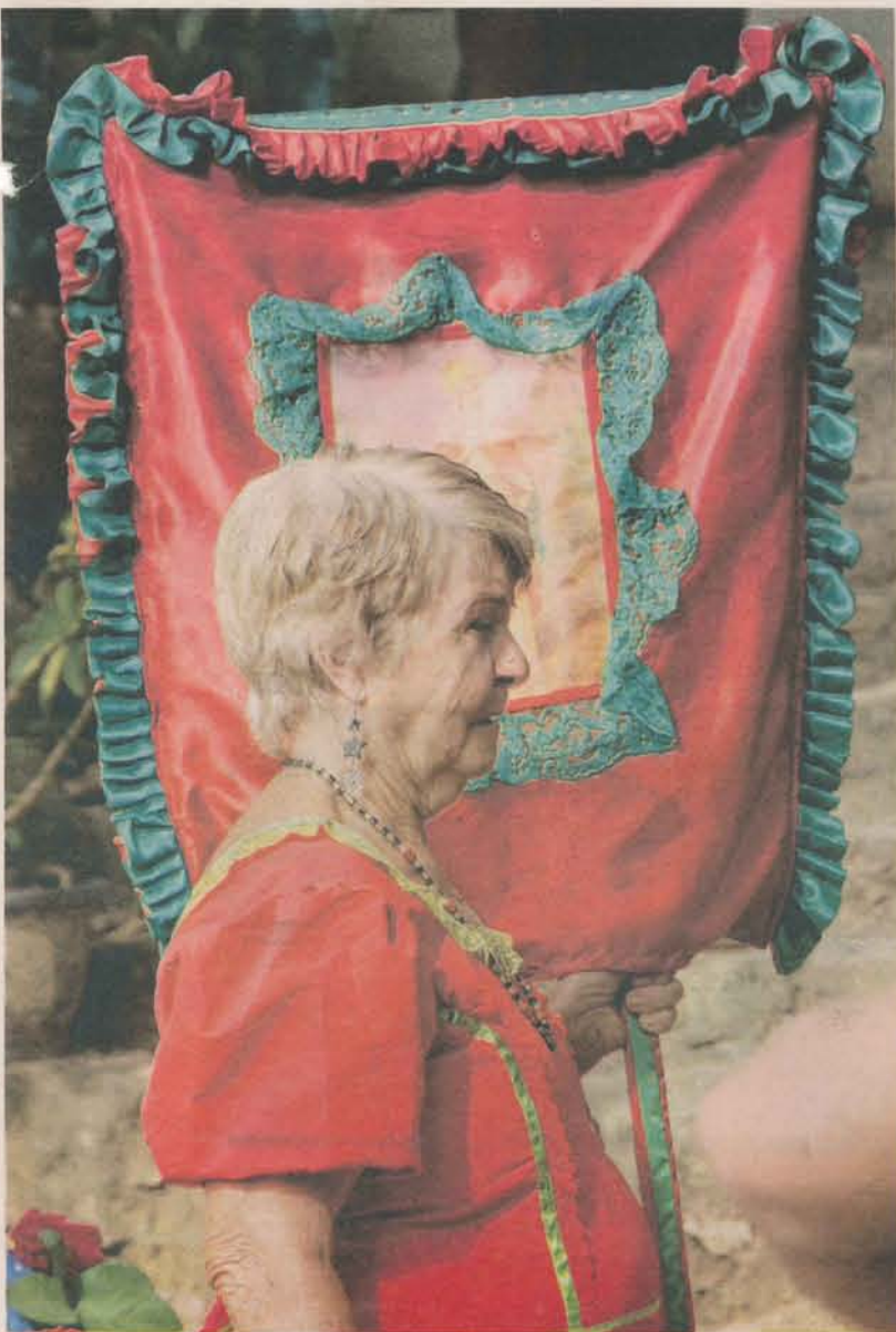
CARNAVAL de Congo de Máscaras de Roda D'Água é tradição