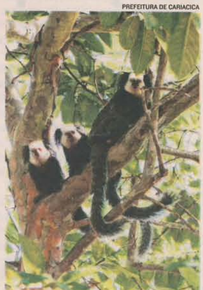
RESERVA de Duas Bocas