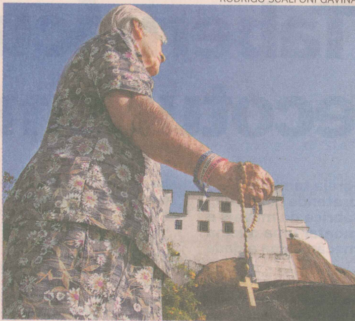
CRENÇA. Foto "Onde as histórias se encontram. Um local de fé". Uma mostra da devoção dos fiéis da Penha