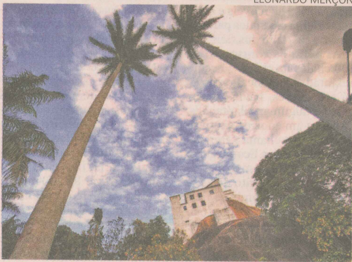
DE BAIXO PARA CIMA. Fotografia "Olhando para o céu". A natureza compõe o cenário do Convento