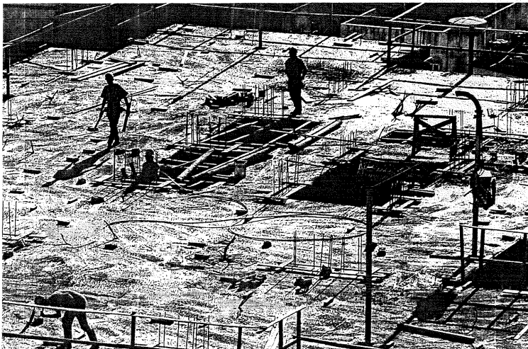
TRABALHO NA CONSTRUÇÃO CIVIL: pesquisa aponta que crescimento no setor foi de 9,2% no Espírito Santo