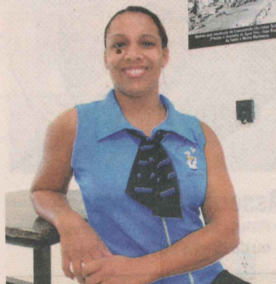
MARLI: espaço para reuniões