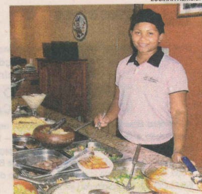
CLEUCILENE: cuidado no preparo

Ainda neste ano o restaurante será ampliado.