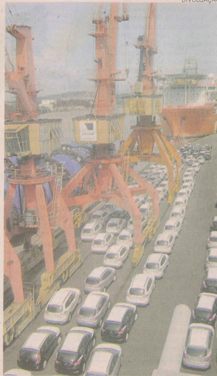
PORTO. Veículos da Kia Motors e Hyundai chegam por aqui

No primeiro trimestre deste ano a arrecadação total do Fundap somou R$ 500,5 milhões. Os municípios receberam de acordo com o índice de cada um, o montante de R$ R$ 125,1 milhões. Vitória, Serra e Vila Velha foram os que ficaram com a maior parte do tributo.