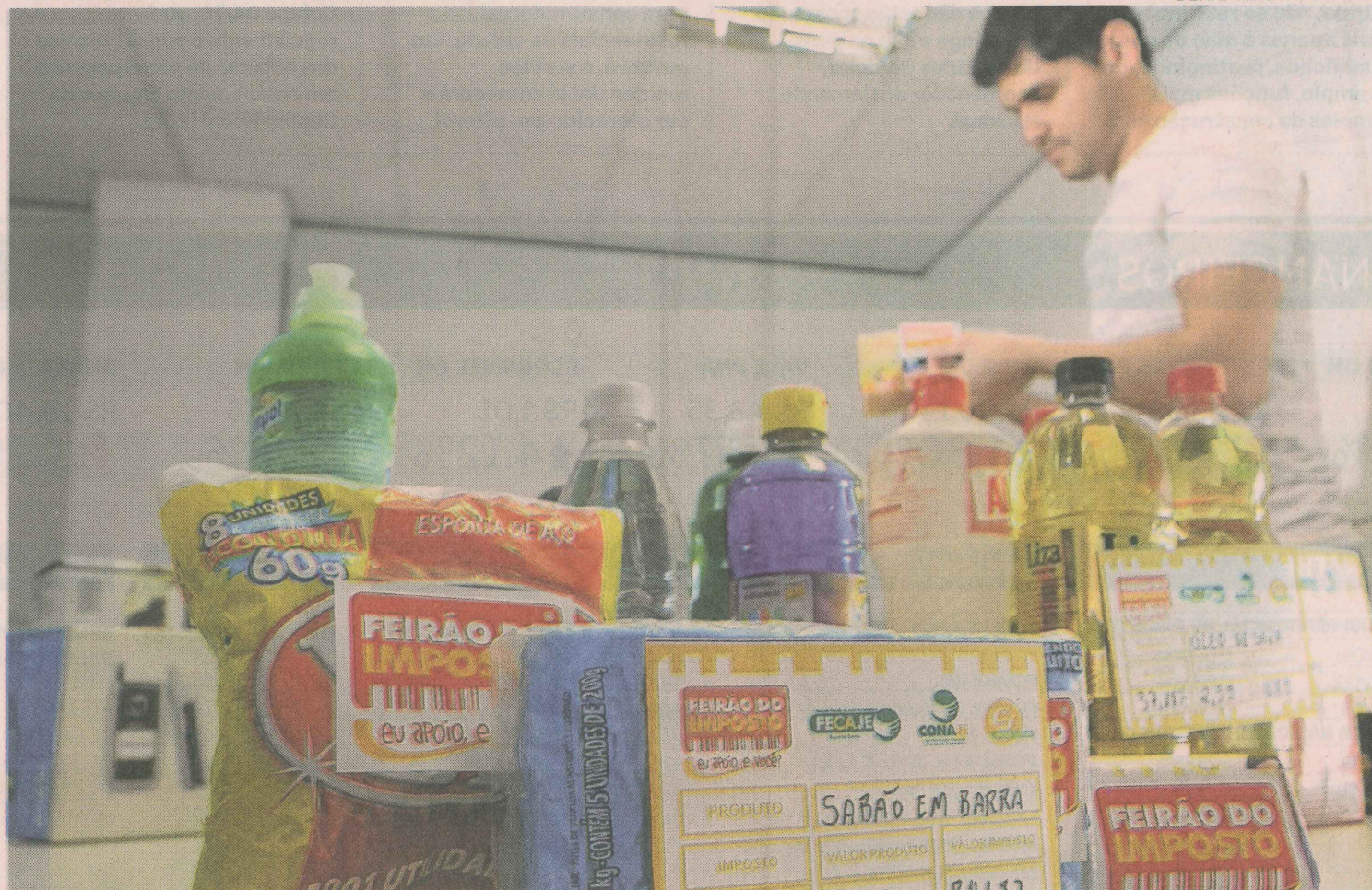
FAÇA AS CONTAS. Feirão vai expor 80 produtos, e cada um deles terá uma etiqueta informando o peso dos tributos no preço final

Neste ano, por exemplo, quem tem rendimento mensal entre R$ 3 mil e R$ 10 mil, trabalhou até o dia 5 de junho para pagar os tributos, segundo estudo do Instituto Brasileiro de Planejamento Tributário (IBTP). E quem tem rendimento mensal acima de R$ 10 mil, trabalhou até o dia