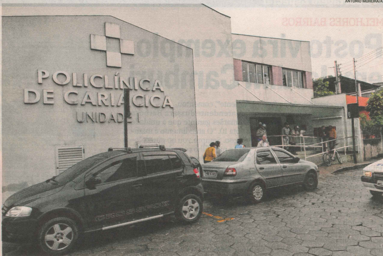
POLICLÍNICA DE CARIACICA, em Itacibá, funciona 24 horas para urgência e emergência, mas recebeu nota ruim

“Estamos construindo uma terceira unidade de saúde no bairro.