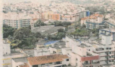
JARDIM DA PENHA: 797 pontos