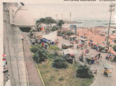
PRAIA DA COSTA: 479 pontos