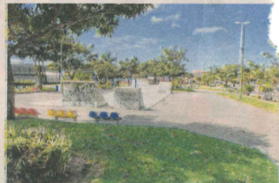
BARCELONA: 678 pontos