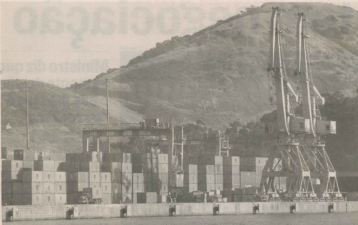
CONTÊINERES no Porto de Vitória: movimentação pode ser afetada com retaliação comercial