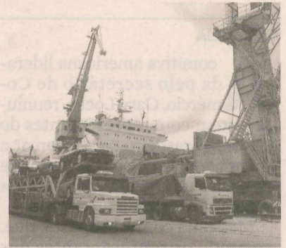
MOVIMENTAÇÃO de carros