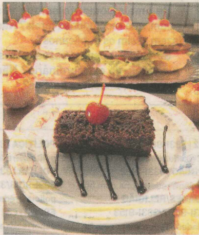
LANCHES E DOCES: investimentos