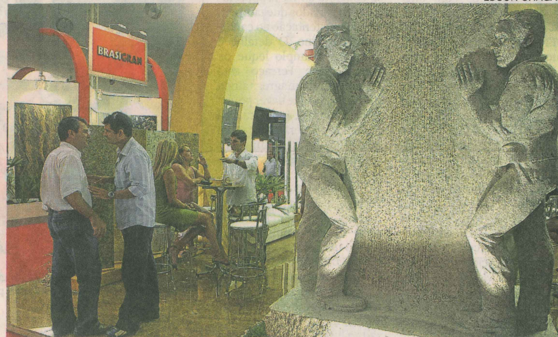
SUCESSO. Vitória Stone Fair vai reunir 370 expositores de 11 Estados e de nove países

As feiras e os eventos atraem participantes locais e turistas e movimentam vários segmentos da economia local. Estima-se que mais de 80 segmentos sejam beneficiados com o turismo de negócios e com os eventos. Somente na Vitória Stone Fair, está havendo a participação de 49 empresas de montagem e decoração de estandes, de paisagem, buffet, locação de equipamentos, segurança, limpeza, tradutores que somam mais de 2 mil pessoas.