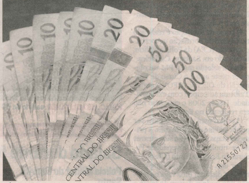
CÉDULAS DE REAL: famílias brasileiras gastaram R$ 54,4 bilhões em juros