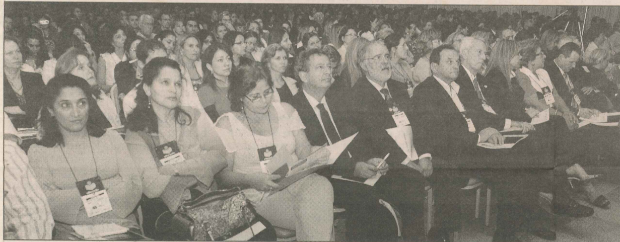
O Centro de Convenções ficou lotado durante seminário de educação da Rede Tribuna

Ela observou que apenas 30% dos estudantes do ensino fundamental prosseguem os estudos e fazem o ensino médio. “Os outros 70% ficam na metade do caminho. Hoje, nada atrai na escola, que é fechada para a juventude. É preciso escutá-los, pois eles também têm muito a ensinar”, ressaltou Miriam.