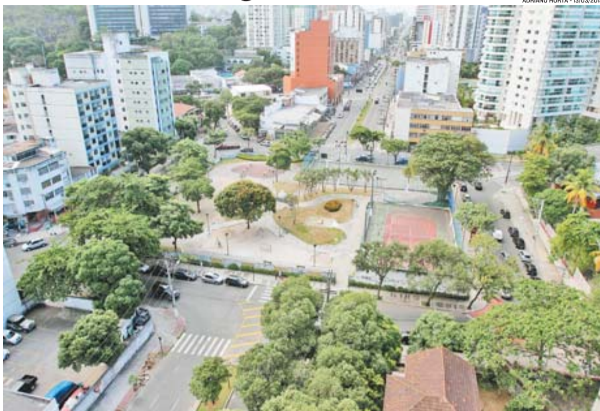
PRAÇA DO CAUÊ, na Praia de Santa Helena, será dividida ao meio para melhorar o acesso à Terceira Ponte

A divisão da Praça do Cauê, que será feita pelo governo do Estado, por meio da Secretaria de Estado dos Transportes e Obras Públicas, tem como principal objetivo facilitar o acesso dos motoristas à Terceira Ponte. Quem vier pela Reta da Penha, poderá passar pelo meio da praça. As obras começam a ser executadas em junho.