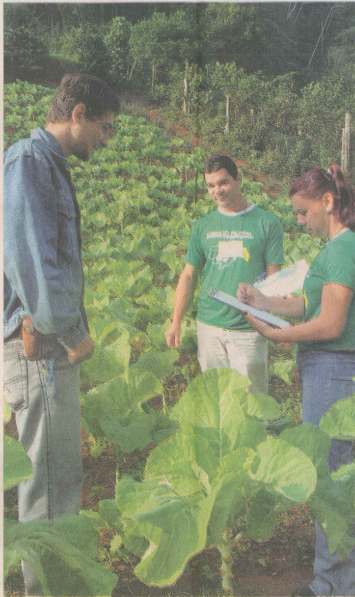
ETAPAS. O produtor de Marechal Floriano passará pelo processo de identificação pessoal e familiar.

OUTROS TEMAS QUESTÕES DE SAÚDE E AMBIENTAIS