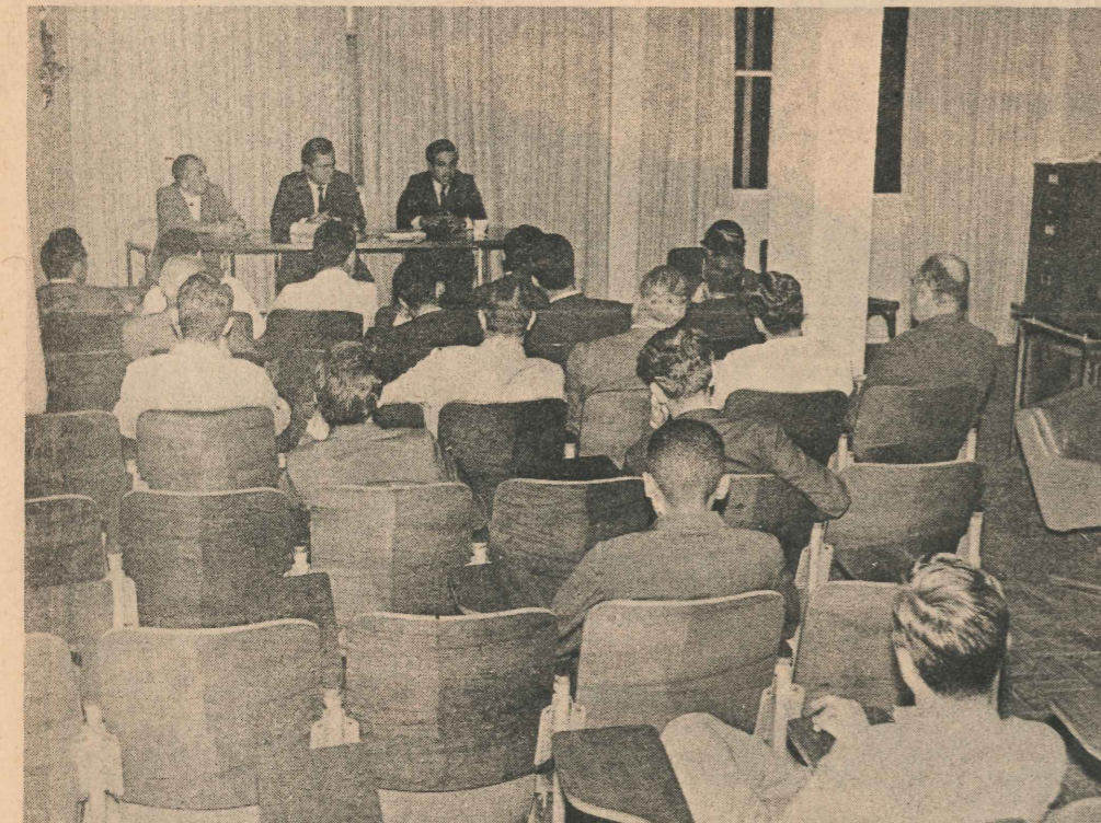
Em abril de 1968, uma das primeiras reuniões preliminares para a fundação do INOCOOP-ES, o que ocorreu no mesmo ano, no dia 8 de agosto.

Nos seus dez anos de atividades o Inocoop-ES formou 16 Cooperativas Habitacionais. Destas, 11 estão em funcionamento, 4 estão desativadas e aguardando dissolução e uma não chegou a entrar em atividade.