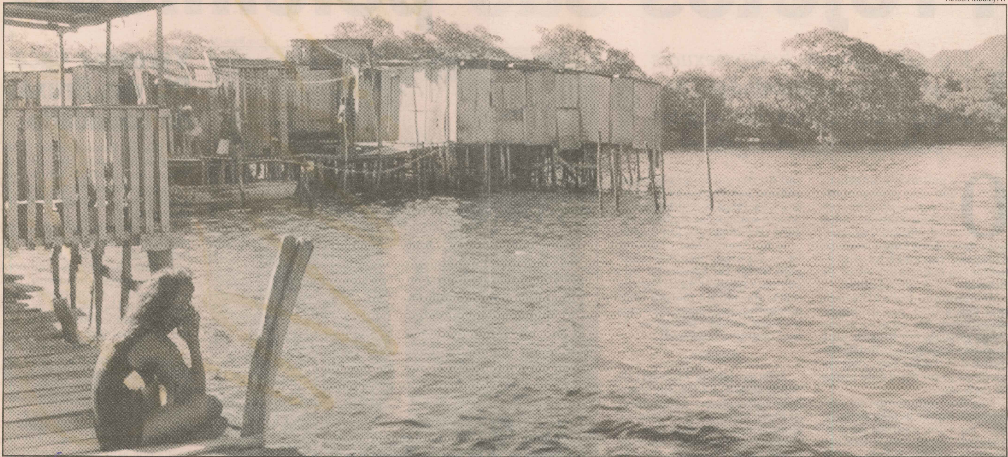
Famílias que moravam em palafitas no Mangue Seco vão se mudar para área urbanizada próxima a Andorinhas no próximo mês