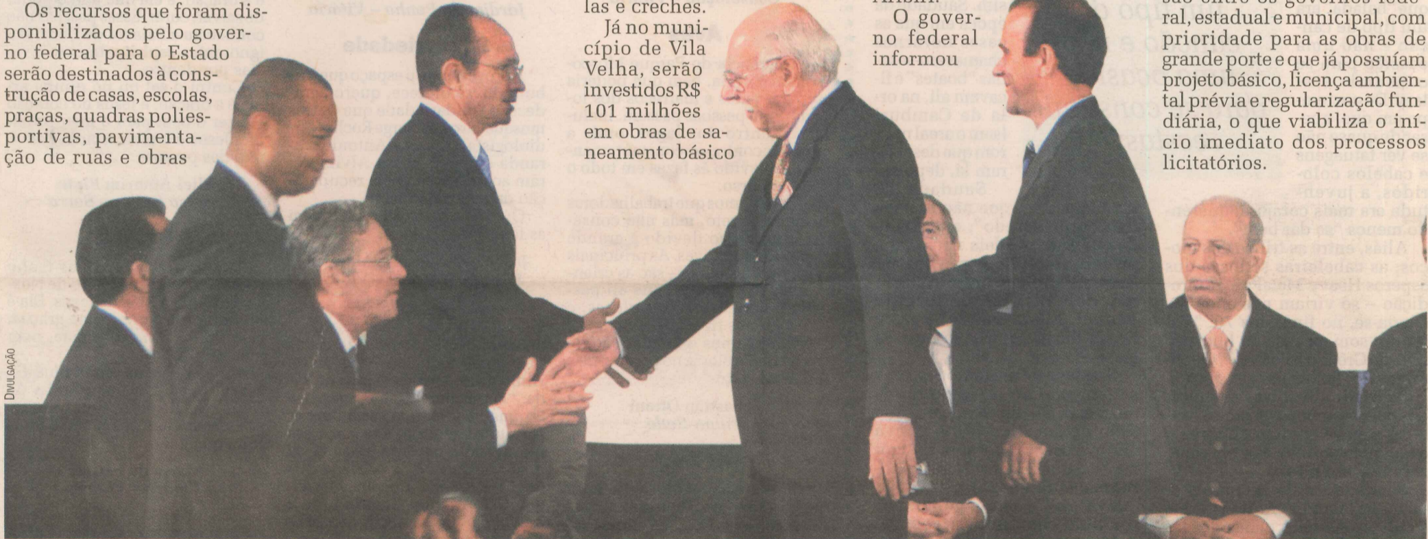
O governador Paulo Hartung, prefeitos e outras autoridades participaram de solenidade em Brasília: obras vão beneficiar 1,4 milhão de pessoas no Espírito Santo

que todos os projetos do PAC de infra-estrutura foram selecionados após uma discussão entre os governos federal, estadual e municipal, com prioridade para as obras de grande porte e que já possuam projeto básico, licença ambiental prévia e regularização fundiária, o que viabiliza o início imediato dos processos licitatórios.