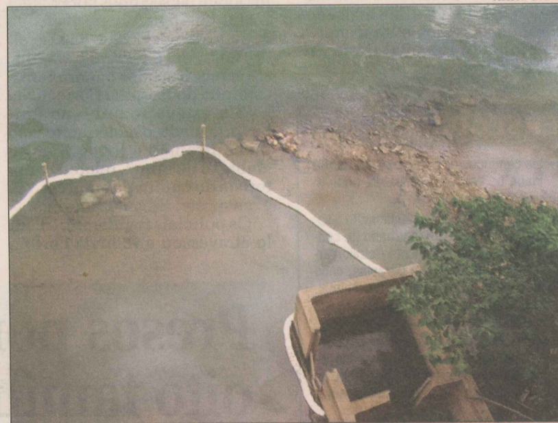
Ponto de captação no rio foi protegido por contenção

situação foi controlada e logo a mancha de óleo se dispersará. O volume de óleo não chegou a causar graves problemas ambientais.