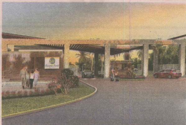
PERSPECTIVA do Riviera Park Residence, que está sendo construído na Barra do Jucu, em Vila Velha. Condomínio terá 310 lotes e área de lazer com lagoa e mirante