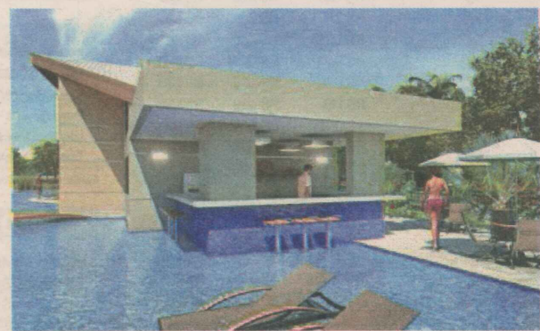
BOULEVARD MAR D'ULÉ: Terreno cercado por uma área de preservação de 65.264,02 metros quadrados na Rodovia do Sol