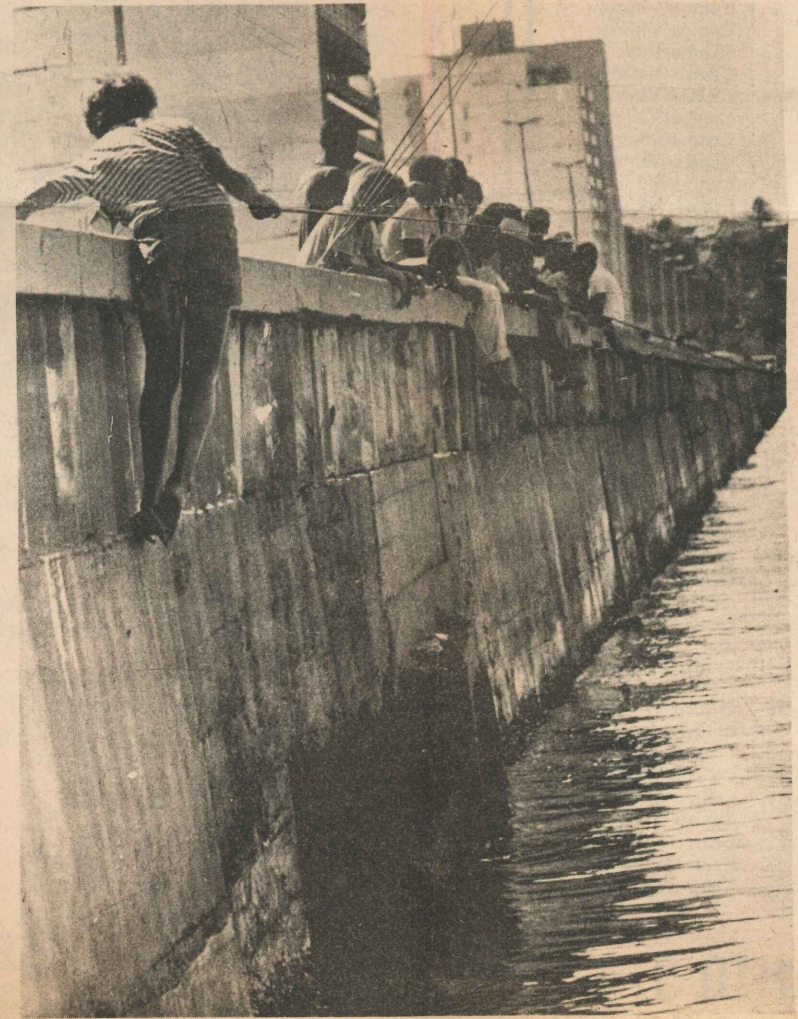
A baía de Vitória é uma das mais atingidas pela poluição