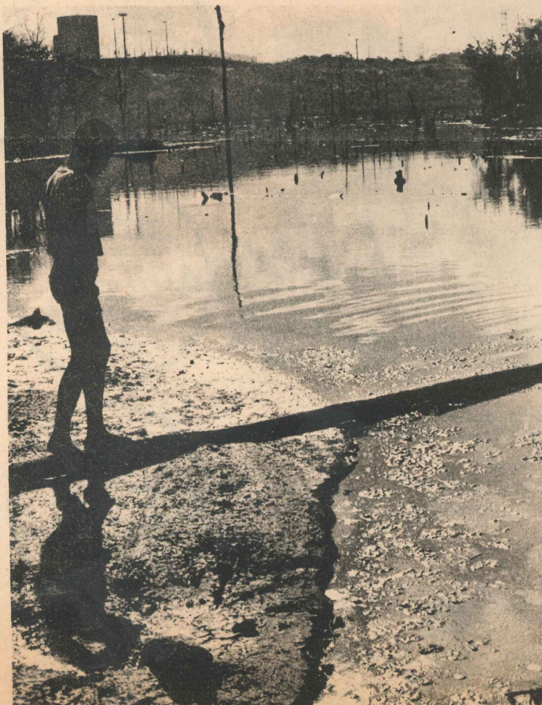
O levantamento vai medir a poluição existente nos mangues

Entre outras coisas mais, a Fundação Jones dos Santos Neves recomendou à Fema estudos sobre problema dos resíduos sólidos na Grande Vitória e caracterização hidrológica e climatológica básica do Espírito Santo.