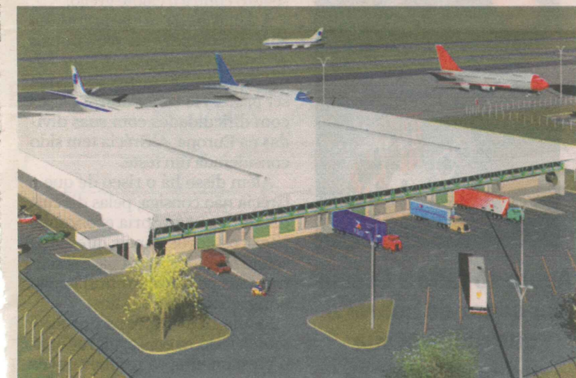
PROJEÇÃO do terminal de cargas do aeroporto a ser construído na Serra

> O VALOR do investimento é previsto em R$ 200 milhões.