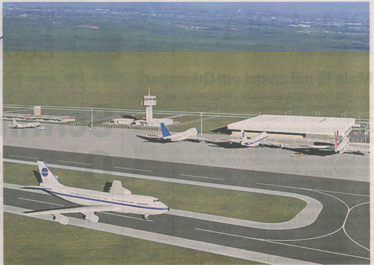
PERSPECTIVA da pista do aeroporto da Serra, que, com 3 mil metros de comprimento, será maior que a de Vitória