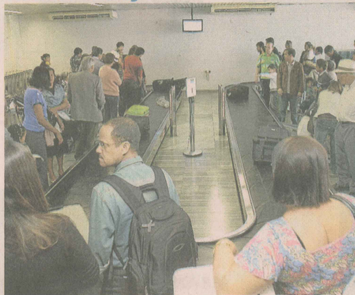
DESEMBARQUE. A área com sala e saguão será quatro vezes maior do que a atual e as atuais esteiras de bagagem serão substituídas por outras duas