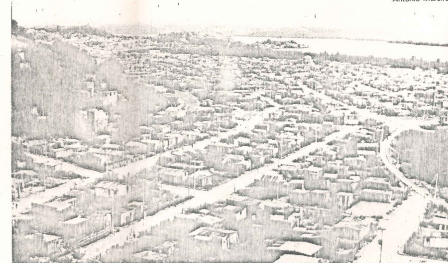
...passou por obras de saneamento para acabar com as palafitas...