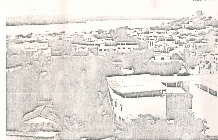
...e hoje, urbanizada, tem terrenos vendidos por até Cr$ 700 milhões