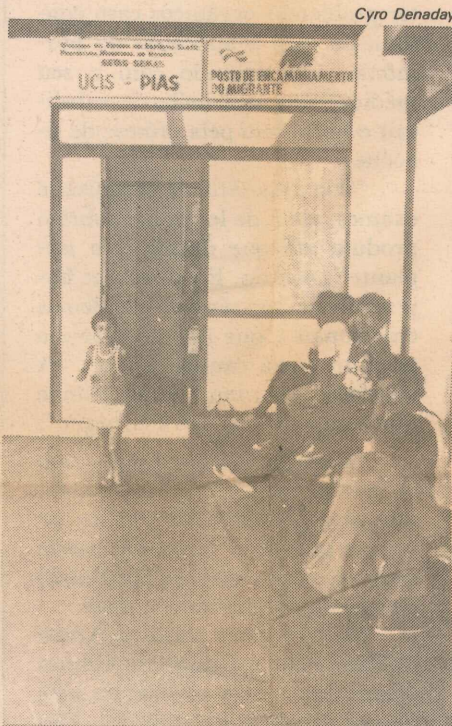
Os postos de apoio têm grande procura

Na Santa Casa de Misericórdia, em Vitória, que também enfrenta um problema de superlotação, há a ameaça de reduzir o número de atendimentos. Vários leitos também já foram desativados nos hospitais Evangélico, em Vila Velha, e Santa Rita de Cássia, em Maruípe.