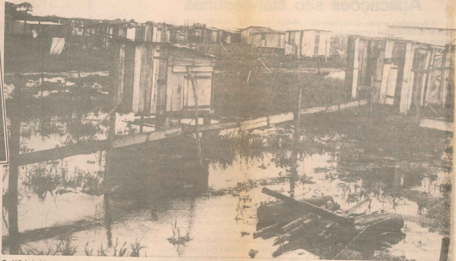
O déficit habitacional que provoca invasões, como a da Barra do Jucu, é uma das principais preocupações

Para evitar o caos sócio-econômico e habitacional na Grande Vitória, a coordenadora de Apoio ao Planejamento do