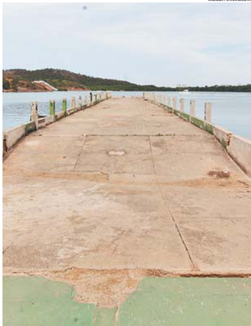
PÍER na avenida Beira-Mar, em Vitória, onde funcionou terminal aquaviário