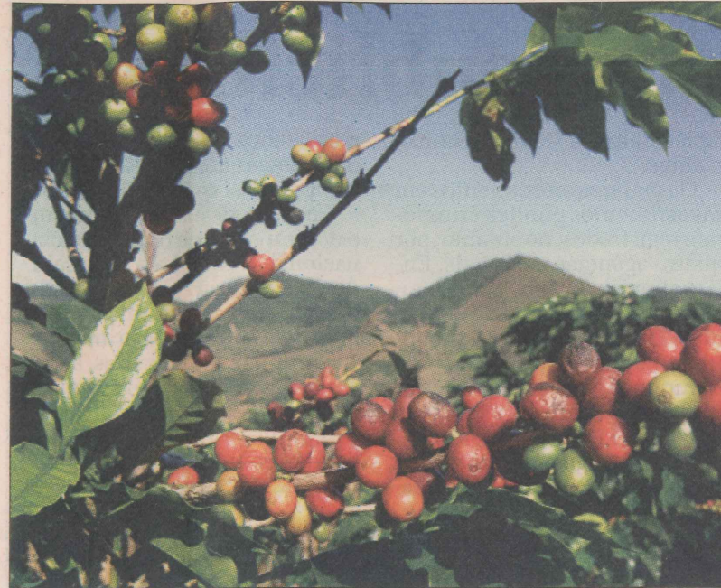
Plantação de café: crescimento de 13,85% nas exportações