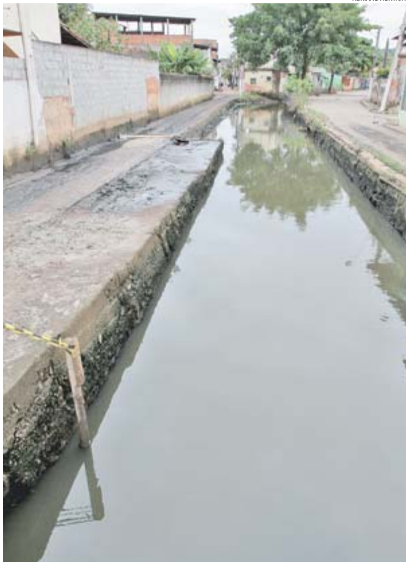
VALÃO DE ARIBIRI , onde a prefeitura vai ter de construir uma nova galeria