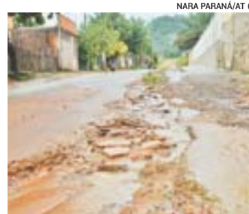
VALE DOS REIS