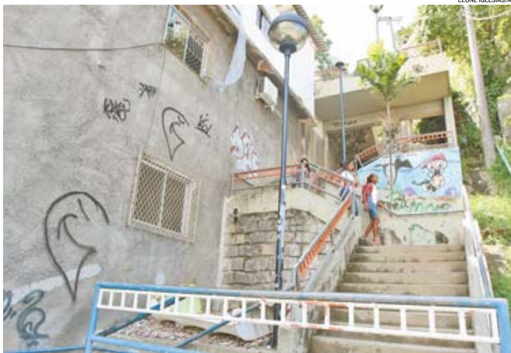
ESCADARIA Hilma de Deus, no Forte São João, que está sem iluminação e perigosa a noite

A SECRETARIA DE TRANSPORTES, TRÂNSITO E INFRAESTRUTURA URBANA DE VITÓRIA informa que a administração está preparando uma licitação para a contratação de um serviço definitivo, com mecanismos rápidos para resolver os problemas de iluminação.