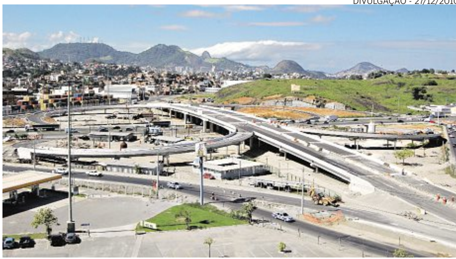
A Rodovia Darly Santos, com localização estratégica, vai abrigar empreendimento

O dinheiro para financiar o projeto está sendo pleiteado no pacote de