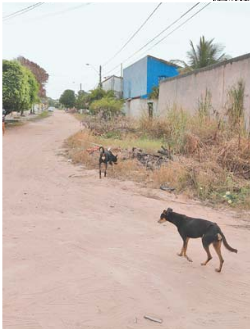
RUA Marlin Azul, na Nova Ponta da Fruta, não é pavimentada nem limpa