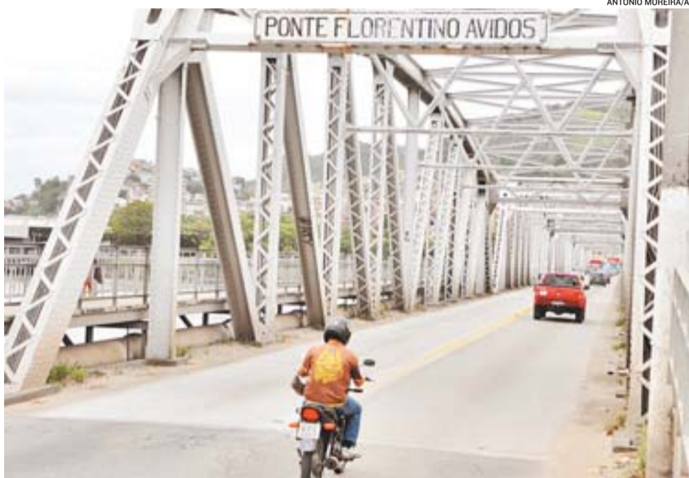
PONTE Florentino avidos, que liga Vitória à Vila Velha e Cariacica tem lâmpadas apagadas

A SECRETARIA DE ESTADO DE TRANSPORTES E OBRAS PÚBLICAS informa que já solicitou à empresa responsável pela obra de restauração da Ponte Florentino Avidos para repor, o mais rápido possível, as lâmpadas que estão queimadas, ou que foram danificadas ou furtadas. Destaca que a manutenção da iluminação na Ponte Florentino Avidos vinha sendo realizada, até então, pe-