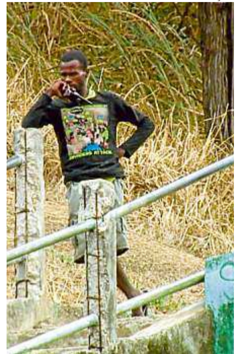
Os olheiros usam radiocomunicadores para informar aproximação da polícia