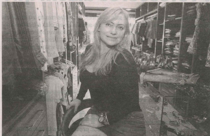
A LOJA DE JANAÍNA PAVAN vai fazer uma liquidação de inverno